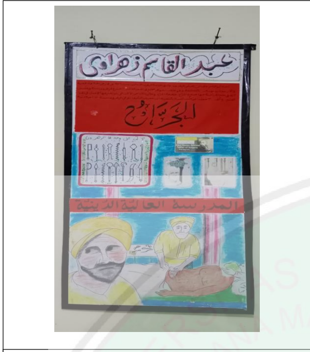
إحدى الوظائف الإبداعية لدى الطلبة