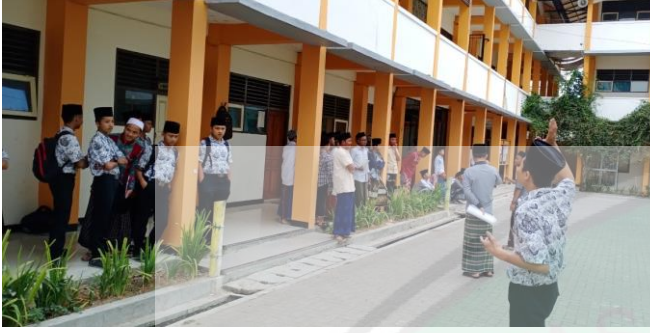
عملية ترقية الكفاءة اللغوية