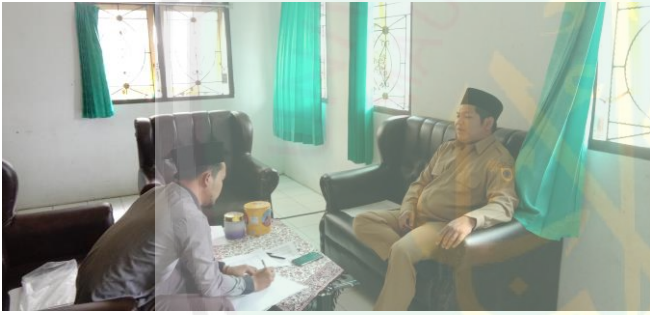
عملية المقابلة مع مسؤول المنهج الدراسي