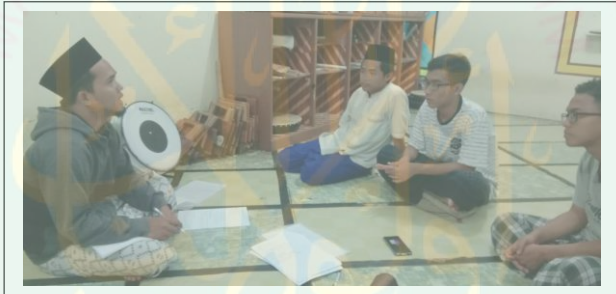
إحدى صورة عملية المقابلة مع بعض الطلبة