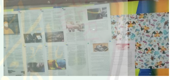
المجلة الجدارية في المدرسة . بعضها مكتوبة باللغة