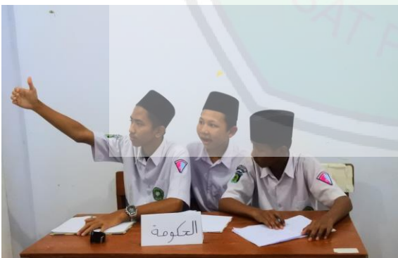
برنامج المناظرة العلمية لترقية مهارة الكلام