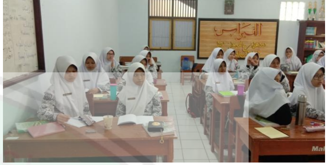
عملية التعليم في الفصل للبنات