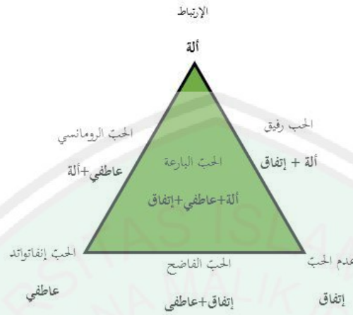
(صورة ٢ . مثلث الحب)

المكونات الثلاثة للحب تتفاعل مع بعضها البعض: على سبيل المثال، قد تؤدي زيادة العلاقة الحميمة إلى مزيد من العاطفة أو الالتزام، كما أن الالتزام الأكبر قد يؤدي إلى مزيد من العلاقة الحميمة، أو مع احتمال أقل، شغف أكبر. بشكل عام، ثم، مكونات قابلة للفصل، ولكن تفاعلية مع بعضها البعض. على الرغم من أن جميع المكونات الثلاثة هي أجزاء مهمة من العلاقات المحبة، قد تختلف أهميتها من علاقة إلى أخرى، أو مع مرور الوقت ضمن علاقة معينة. في الواقع، أنواع مختلفة من الحب يمكن أن تتولد عن طريق الحد من حالات مجموعات مختلفة من المكونات. مكونات الحب الثلاثة تولد ثمانية أنواع ممكنة من الحب عند النظر في الجمع. من المهم أن ندرك أن هذه الأنواع من الحب، في الواقع، تحد من الحالات: لا علاقة لها على الأرجح أن تكون حالة نقية من أي منها. (روبيت ج ستنبروغ، ١٨٩٧، ص. ١٩٩)