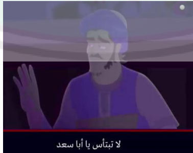
لا تبتأس يا أبا سعد

الأفعال الكلامية التوجيهية التي يقصد أن ينصح المتكلم المستمع في الكلام بأن يعمل المستمع ماقاله