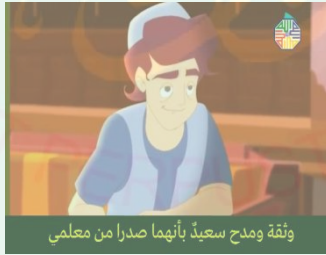
وثقة ومدح سعيداً بأنهما صدرا من معلمي

أبو عبدالله النائلي: أمر رائع! طاقة وحماس أحب أن يتصف بهما تلميذي