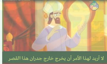
لا أريد لهذا الأمر أن يخرج خارج جدران هذا القصر

الأفعال الكلامية التوجيهية التي يقصد المتكلم المستمع في الكلام بأن يعمل المستمع ماقاله