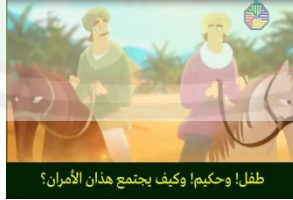
طفل! وحكيم! وكيف يجتمع هذان الأمران؟

الأفعال الكلامية التعبيرية التي يقصد أن يلوم المتكلم إلى المستمع