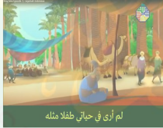
لم أرى في حياتي طفلا مثله