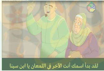
لقد بدأ اسمك أنت الآخر في اللمعان يا ابن سينا

في سياق الكلام، استعان والد الحسين ابن سينا بالعالم الشهير في ذلك الوقت، وهو أبي عبدالله النائلي ليساعد ابنه في تحصيل المزيد من العلم. وكما كانت فرحة ابن سينا بمعلمة الجديد، كان المعلم سعيد بتلميذه أيضا. وسمع أبي عبدالله النائلي عن ابن سينا قبله أن ابن سينا فتى نابه وكثيرون يشيدون بذكائه ومعرفته. وقال أبو عبدالله النائلي أن ابن سينا حب العلم. وقال ابن سينا إلى مدرسه أن أن النوم أمر لا مفر منه، لقضي كل وقته في القراءة والملاحظة والتدوين والتجريب. ثم مدح أبو عبدالله النائلي إليه أن هو يجبه لأنه طاقة وحماس وقوله بالسعيد والضحيق. ثم يريد ابن سينا لمدحه أيضا.