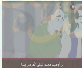
لن أوصيك مجددا لبقى الأمر سرا بيننا

ابن سينا: يمكنك الذهاب إلى القصر الان وسألحك بك عندما أنتهي الطبيب ٢: لن أوصيك مجددا لبقى الأمر سرا بيننا