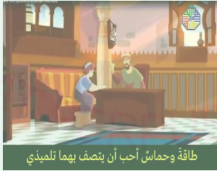
طاقة وحماس أحب أن يتصف بهما تلميذي

حال وسياق كلامه كانت شهرت ابن سينا قد سبقته إلى مدينة بخارى. في بخارى، كان شخصان يراكبان الفرس ويتحدثان عن ابن سينا. قال الشخص ١ إن معهم طفلاً حكيماً، هو ملم بالكثير من العلوم وإنه رغم صغيره. ولكن لا يصدق الشخص ٢ إليه. لا يمكن الطفل وهو الحكيم ويملك ملم كثير من العلوم حتى يريد أن يواجه ابن سينا لإثبات ذلك. ثم ذهبان إلى بيت ابن سينا وسأل شخص ١ إلى أبي ابن سينا أن ابن سينا واسع المعرفة والإطلاع، فهل هذا حقيقي؟ وأمر أبوه لجوابه، ثم جاوب ابن سينا أنّ الله هبه موهبه عظيمة يعني حب العلم منذ صغيره، فينبغي على أن يحافظ عليها. زاد ابن سينا في قراءته وإطلاعه، وكلما توسع مداركه. وبذلك، عجب شخص ١ وشخص ٢ إلى فكرته. إذان، يريد شخص ٢ لمدح ابن سينا أنه ماهر وحكيم ولا يجد كما هو قبله. وهو يصل في كلامه.