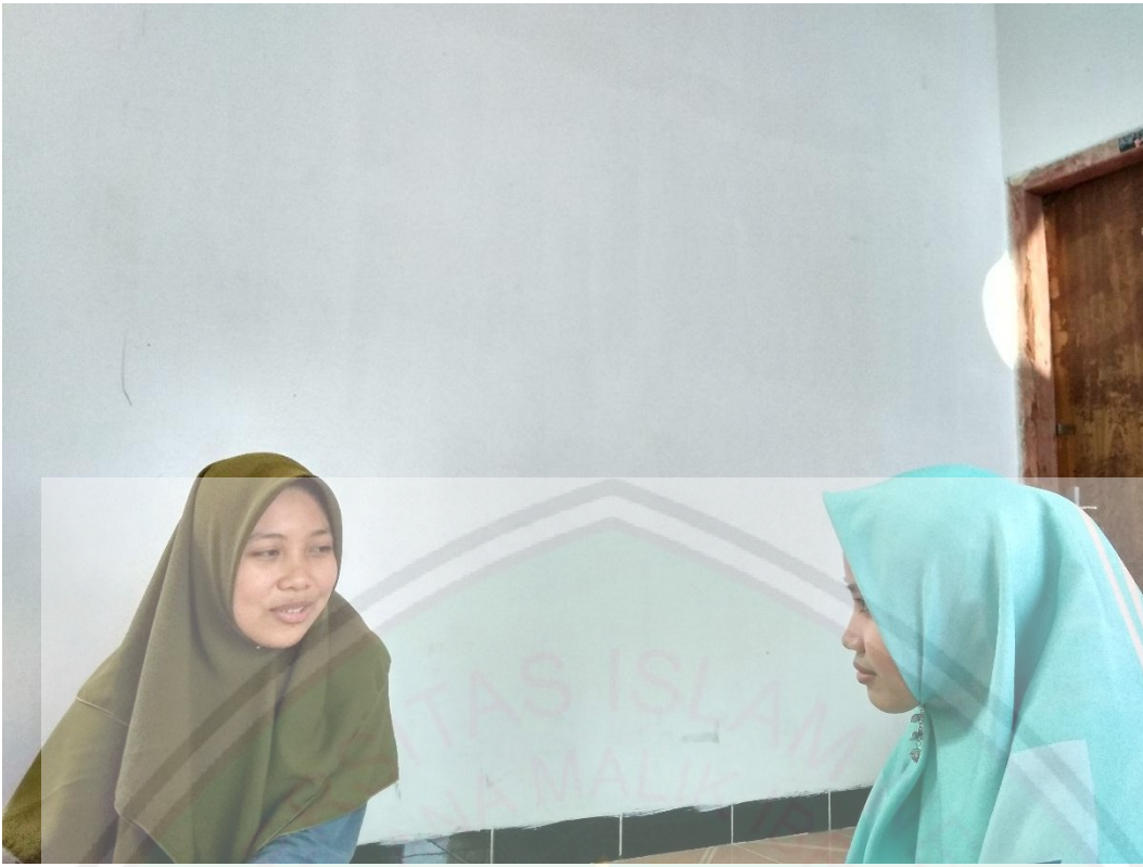
المقابلة مع طالبة قسم تعليم اللغة العربية