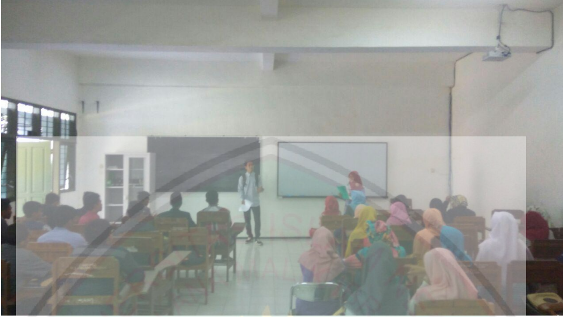
تعلم مواد علم البلاغة (الملاحظة)