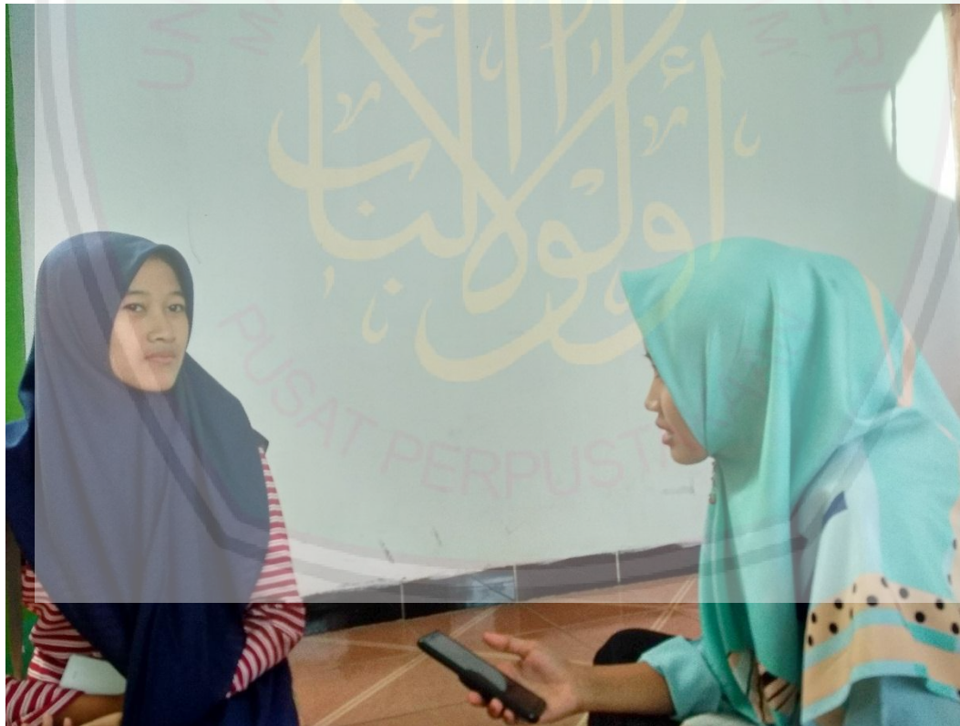
المقابلة مع طالبة قسم تعليم اللغة العربية