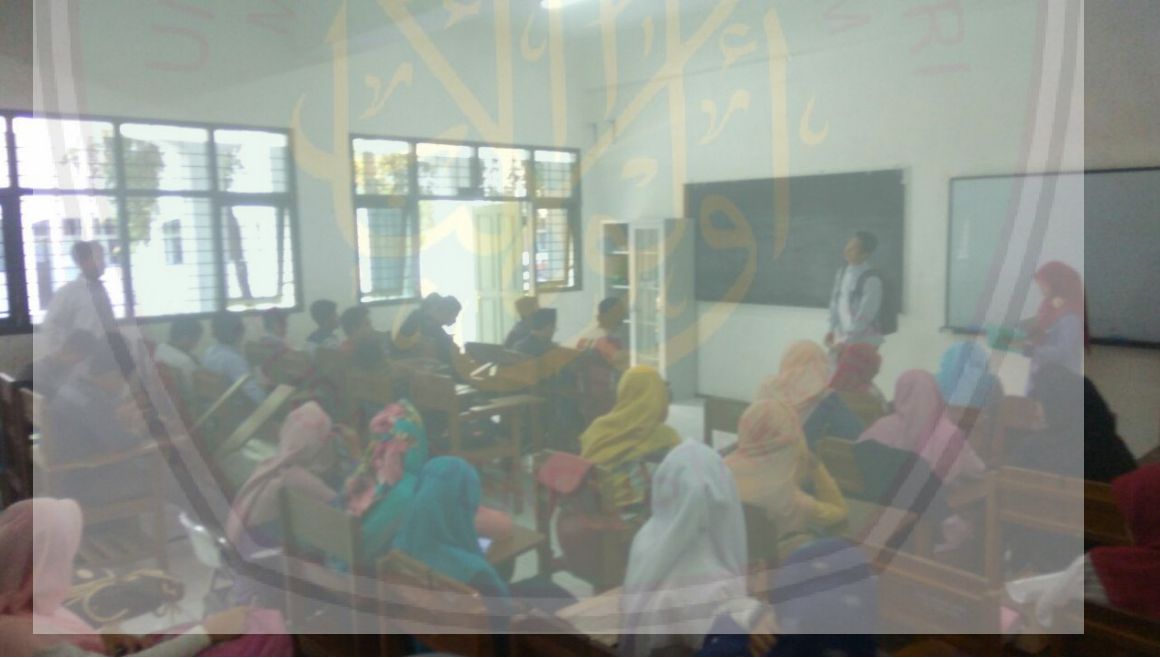
تعلم مواد علم البلاغة (الملاحظة)