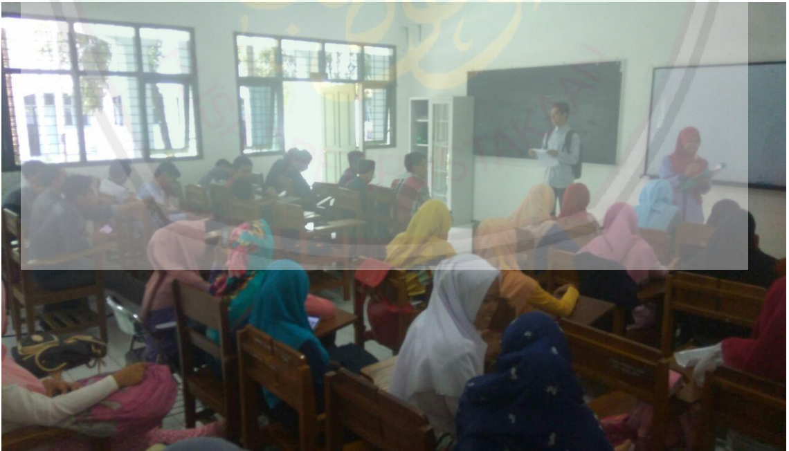
تعلم مواد علم البلاغة (الملاحظة)