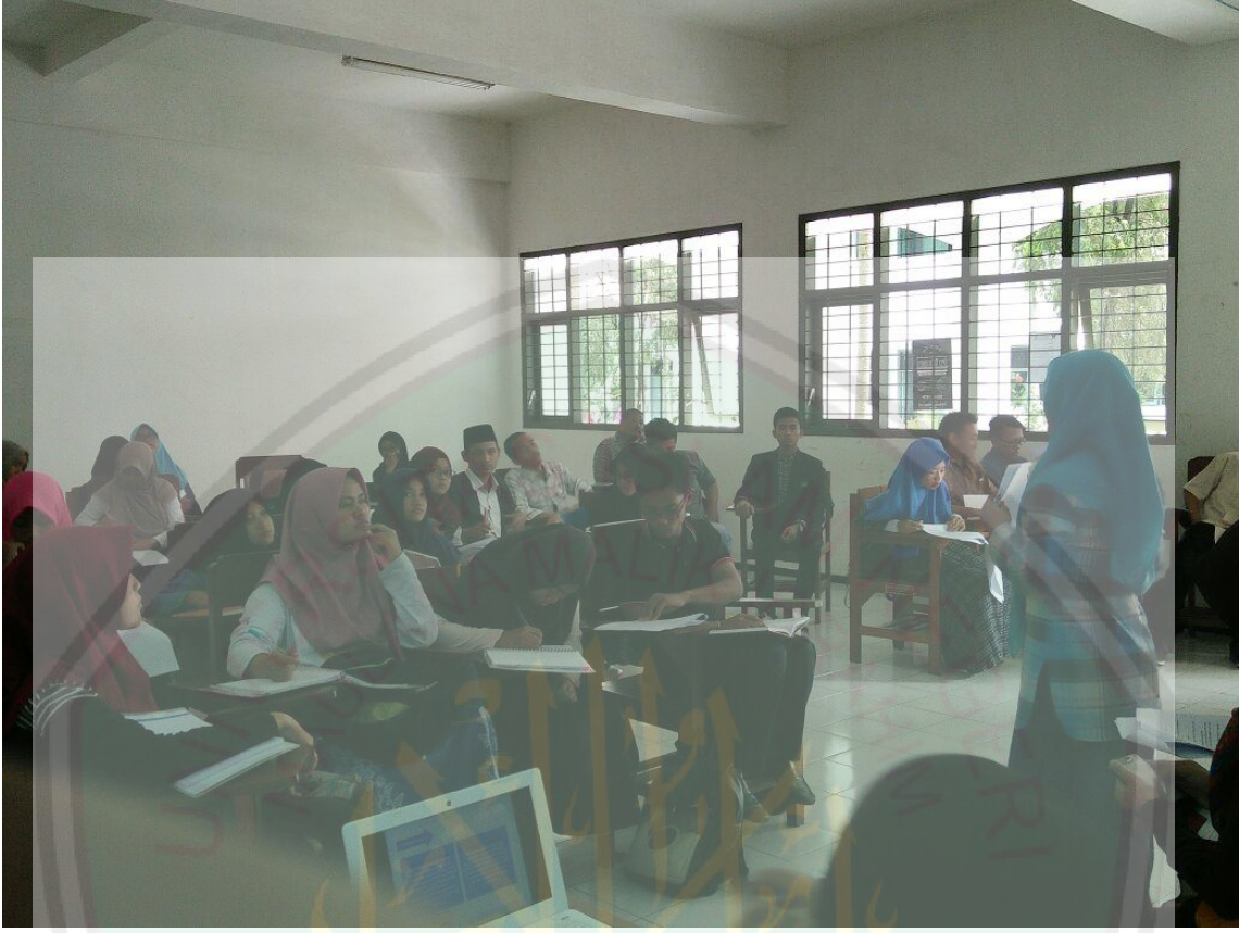
تعلم مواد علم البلاغة (الملاحظة)