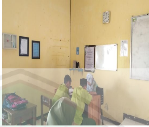
مناقشة بين المعلم والطلاب