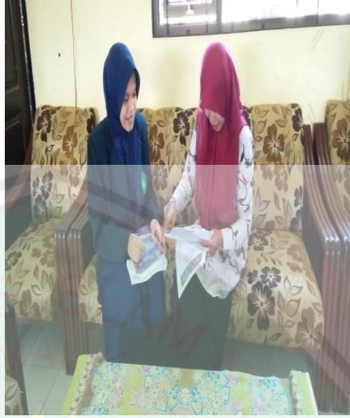
المقابلة بين المعلمة والباحثة