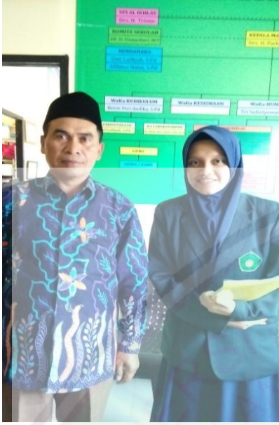
رئيسة المدرسة والباحثة