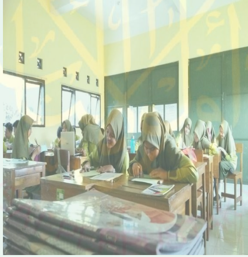
عمل بورتوفوليوو الطلاب