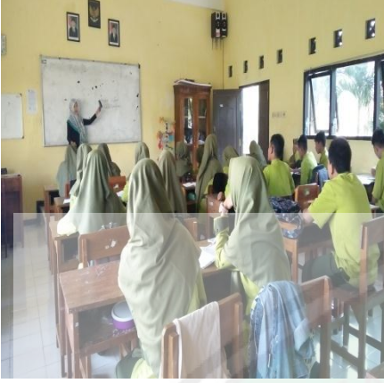
ملاحظة عملية التعليم