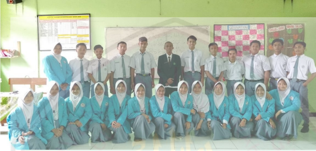
الطلاب في فصل التجريبي