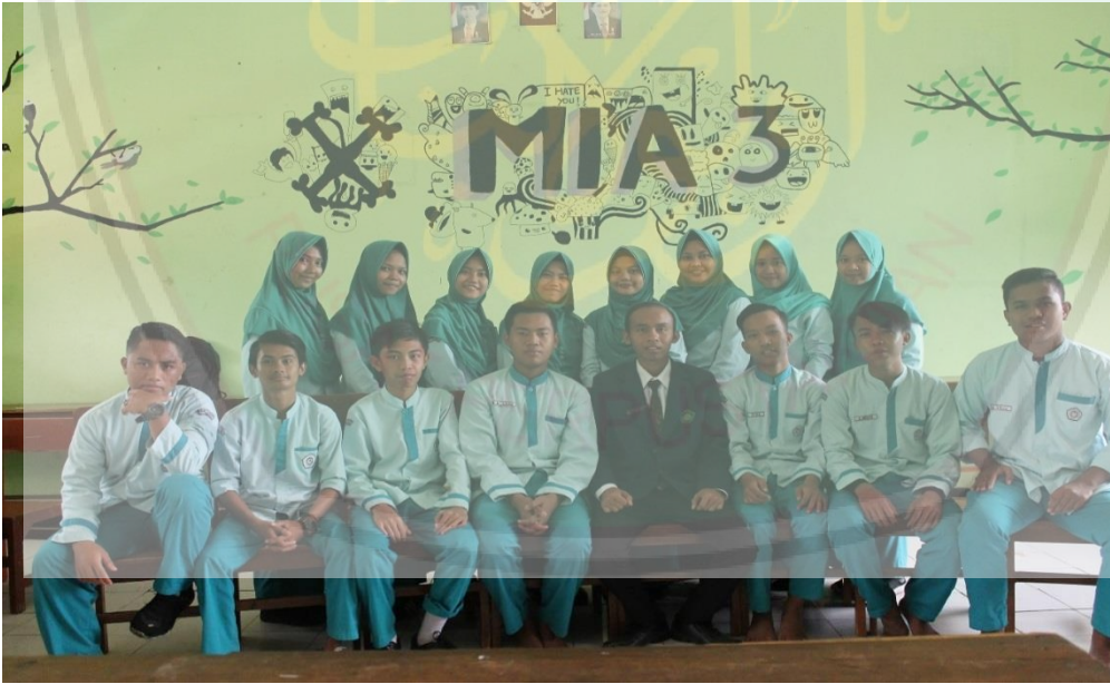
الطلاب في فصل الطابط