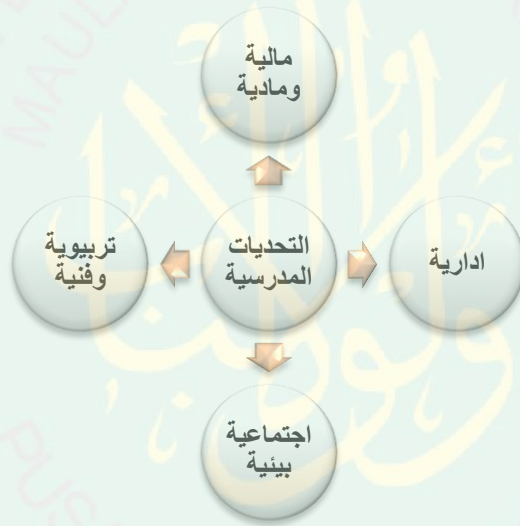
شكل رقم (5) التحديات التي تواجه مدرسة الغزالي للتعليم الأساسي. (241)

د- الصعوبات الاجتماعية: وهي أحد العقبات التي اكدت البيانات بأنها تواجه مشكلة الآثار السلبية على سلوكيات بعض التلاميذ. ولتوضيح هذه التحديات بشكل أكثر دقة قامت الباحثة اعتماداً على نتائج البيانات بتصميم الشكل التالي: