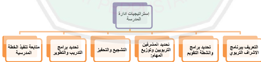
شكل رقم (3) الإستراتيجيات المدرسية المعتمدة بمدرسة الغزالي، المصدر (239)

و- متابعة تنفيذ الخطة المدرسية: اكدت البيانات بان نظام المتابعة الذي تعتمد عليه إدارة المدرسة يتضمن القيام بمراقبة الأنشطة التربوية اليومية من خلال الاجتماعات الأسبوعية والزيارات اليومية لفصول الدراسة ومرفق المدرسة الأخرى مثل قاعات الاجتماعات والمعامل والمكتبة والمسرح وغيرها، للوقوف على المشاكل والصعوبات التي تواجه المعلمين والمعلمات والتلاميذ. وللتوضيح أكثر قامت الباحثة بتصميم الشكل التالي: