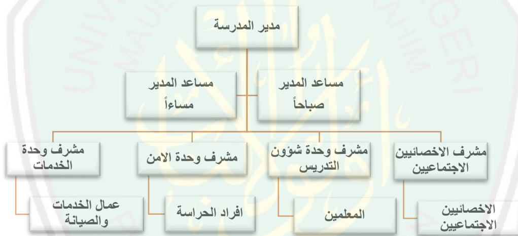
الشكل رقم (1) الهيكل التنظيمي لإدارة مدرسة الغزالي للتعليم الأساسي (184)

قامت الباحثة بالتواصل مع إدارة المدرسة من خلال برامج الاتصال عبر الانترنت (واتس اب، سكاى بي) كما قامت الباحثة بالاتصال بالمسؤولين والاختصاصيات بمدرسة الغزالي على مدى ثلاثة أيام متتالية بتاريخ 10،11،12، من شهر فبراير 2019. حيث قامت الباحثة بعرض أسئلة المقابلة على المستجوبين، والذين أبدوا تعاون كبير بعد اعطائهم فكرة عامة على موضوع البحث، كما قامت الباحثة بتكليف فريق عمل يتكون من شخصين، حيث كلف الأول بتوزيع نماذج الاسئلة على