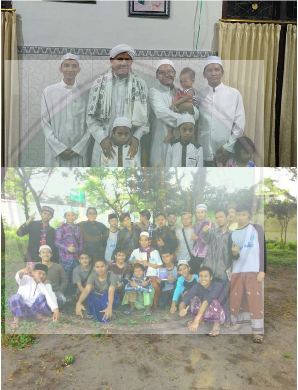
Foto keluarga directur OCEAN. Dan foto kegiatan di luar kelas.