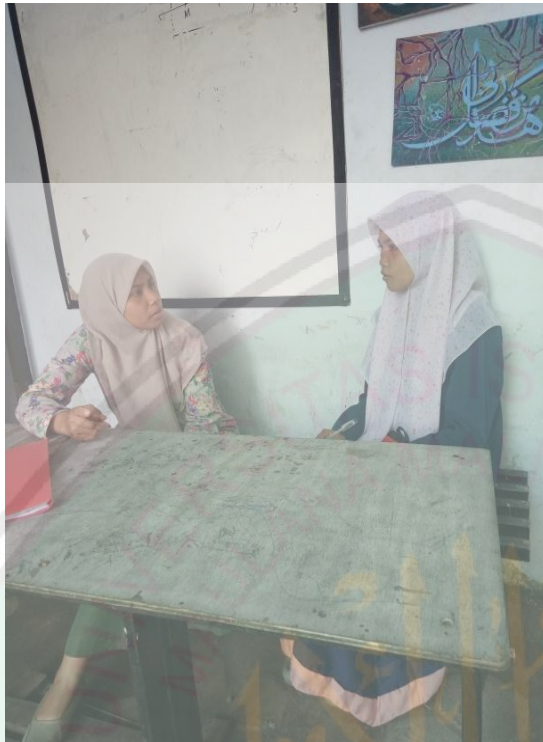
Wawancara dengan Guru Pembimbing Tahfidz