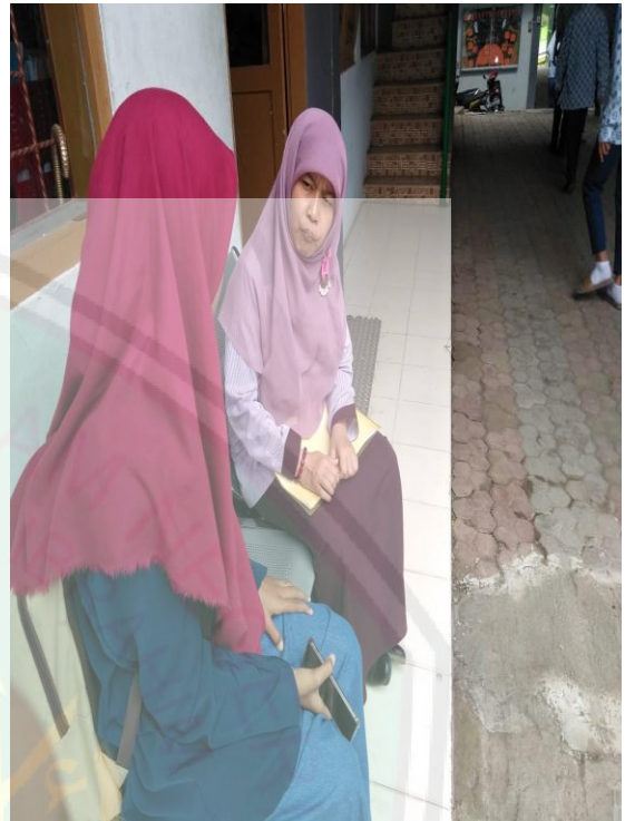
Wawancara dengan Guru Koordinator Tahfidz