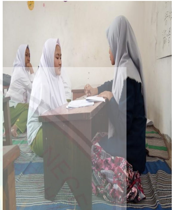
Wawancara dengan Siswi Kelas 9 Program Tahfidz