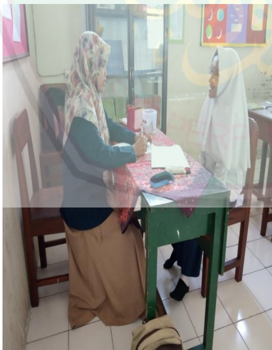
Wawancara dengan Siswi Kelas 9 Bina Prestasi