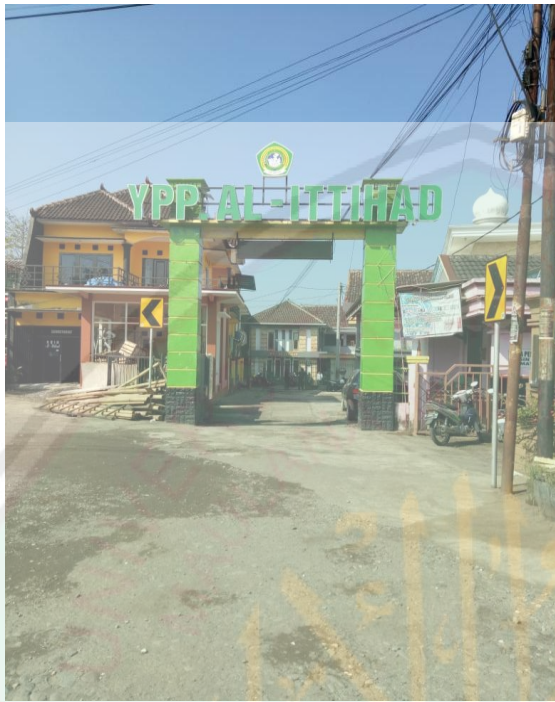
Pintu Masuk MTs Al-Ittihad