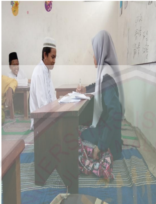
Wawancara dengan Siswa Kelas 9 Program Tahfidz