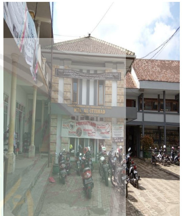
Halaman Depan MTs Al-Ittihad