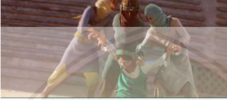
الصورة ٥: مثل العبد كالحَيوان