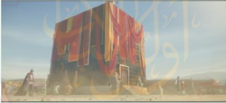
الصورة ٣: حالة المجتمعة المدينة حول الكعبة

في الصورة أعلاه، تم تصوير روح الحرب في هذا الفيلم. خاصة هجوم القبيلة الأمويين على قبيلة البلال. وعاما يقيم هذا الهجوم من أقوى القبيلة، الذي توضح في ذلك الفيلم وضوحا تاما عن كيفية الهجوم هذه القبيلة في الصيف. لأن الظروف المناخية في المنطقة الصحراوية شديدة الحرارة بحيث تؤدي إلى مكان من الروح القتالية التي تعتبر حالة عقلية مزمنة.