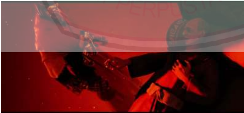
الصورة ٢١: رجل عجوز يخشى الموت، يدفع للكاهن ليخلصه