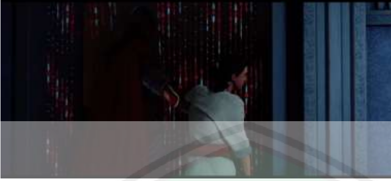
الصورة ٨: الظلم للعبيد

في التفسير ما مضى، هناك الظلم الذي يعمل الأمية إلى العبد وهو بلال، الذي يريد أن يحفظ أخته من هجوم ابنه (سفيان) الذي أراد أن يؤدي العبد خاصة المرأة.