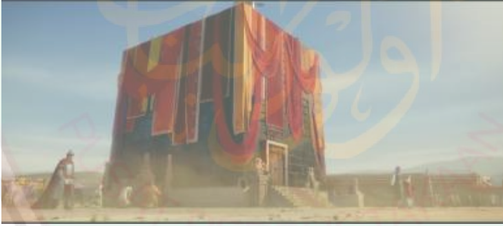
الصورة ١٣: عبادة الأصنام حول الكعبة

كان في البداية قبيلة القريش ومجموعة الكفار يتبع الدين التوحيد الذي يحمل نبينا إبراهيم وإسماعيل عليهما السلام. ولكن بعد وافتهما ليس الرسل الذي يستمر هذا الإعتقاد فصار العرب يعتنقون الدين المختلط. أما كون الدين والاعتقاد الذي كان في وسط المجتمع العربي في ذلك الوقت حزينه للغاية. في عصر قبل الإسلام كان العرب يعرب بعصر الجاهلية. هذا العصر الجاهلية هو عصر لا يتعرف بدين التوحيد الذي يجعل أخلاقهم الحد الأدنى.