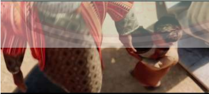
الصورة ١٠: الطفل يطلب بعض المال لشراء الطعام

"سيدي، من فضلك أعطني بعض المال، أريد الطعام أو المال، لا طعام لديك؟"، أريد أن آكل"