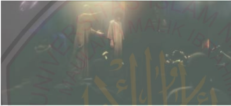
الصورة ٤: مجال التعدين والعبيد

"ما التاجر الذي تقدمه؟ هذا العبد الخاص يمكن أن يكون لك، أي شخص محاولة؟"