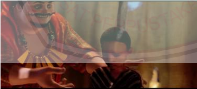
الصورة ٦: بائع العبيد

قال إحد البائع العبد في مقتطف المحادثة التالية: "هذا العبد الخاص يمكن أن يكون لك، أو شخص آخر؟" "أفضل عبد في هذه المدينة، إنه ذكي لمعرفة كيفية القراءة والكتابة، إنه يعرف ٢٠ لغة، حتى أنه يستطيع التحدث مع الحيوانات." "