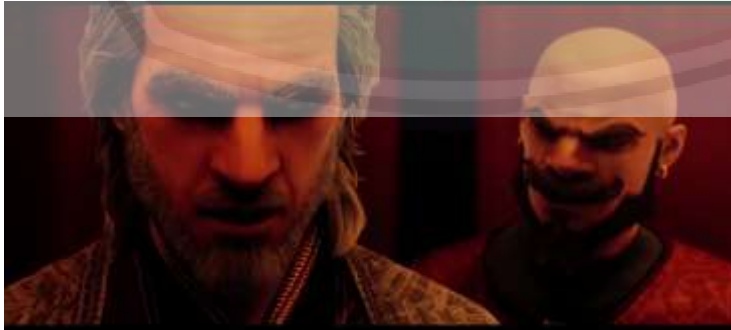
الصورة ١٧ : شهادة أمية عن عقيدته

"هناك سيد واحد فقط، وهو المال، وهذا هو الإيمان الحقيقي في مدينتنا."