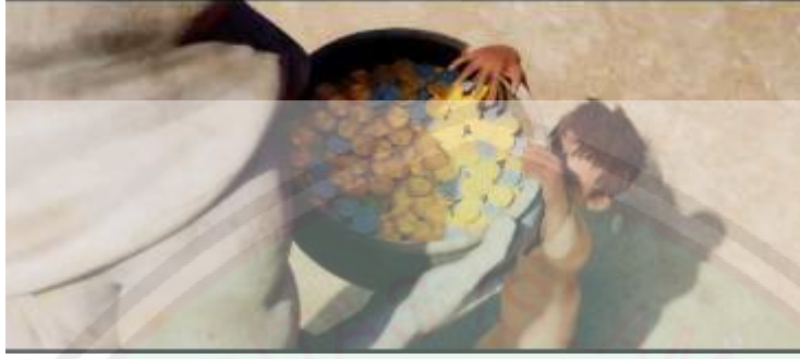
الصورة ١١: سيسرق الطفل بعض المال بسبب الجوع

توضّح صورة الفقراء التي وصفها أيمن جمال في المقطع فيلم بلال أعلاه، حيث يوجد الطفل يطلب بعض المال لشراء الطعام بسبب الجوع.