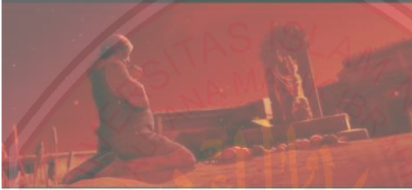
الصورة ١٩: تقدمت المرأة قربانا إلى أصنام ليرزق بالصبي

فتقدمت قربانا وتتوسل إلى أصنام ليرزق بالصبي. رجل فريح يخشى الفقر، فيقتسم قليلا من المال لآلهة ويعد بالمزيد إن ساعدت منه الثروية. كان رجل عجوز يخشى الموت، فيدفع للكاهن ليخلصه. هذا الخوف تجبرهم على البحث الملاذ بين الأولئك الآلهة."