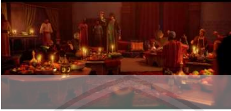
الصورة ١٤: عادات سيئة للمجتمعات العربية مثل شرب الخمر

وفي ذلك الوقت، كانت المجتمعة العربية لهم عادات سيئة مثل شرب الخمر والزنا وعبادة الأصنام. لقد احتضنت العربية أنواعًا مختلفة من الدين والأخلاق والعادات والقواعد قبل ظهور الإسلام. الإسلام يلتقي بدين الجهل.