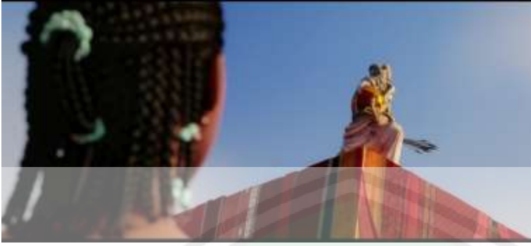
الصورة ١٥: وضع الأصنام على الكعبة

عبادة الأوثان المبينة في هذا الفيلم هي كان الأصنام تضع حول الكعبة التي هي مركز العبادة لأهل القريش. هناك أيضا الأصنام الكبيرة التي تضع فوق الكعبة. كل الأصنام الذي يعبدونها هم يعتقدون أنهم إلههم كما في الصورة أعلاه.