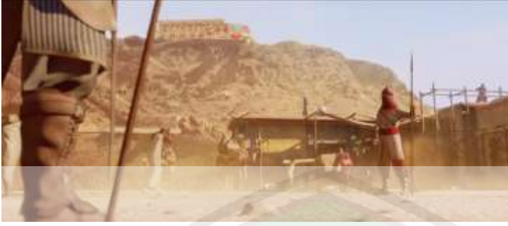
الصورة ٩: الفقراء العرب الذين يعملون في التعدين

جزء الكلمات أعلاه هو شكل من أشكال تأكيد هوية الفقراء العرب الذين يعملون بالجد في التعدين وأصبحوا عبئاً للنبلأء. أنّ أيمن جمال يريد أن يوصف هذا الفيلم بحالة المجتمع العربي الفقير مع العمل الشاق، ووصف كلمة الفقراء لم يذكر مباشرة بأيمن جمال في ذلك الفيلم، ولكن الإستجاب في العمل الشاق يؤكد حالة المجتمع العربي الفقير. إنّ حالة المجتمع العربي الفقير لا يستوي بالثروة الوفيرة للموارد الطبيعية للنفط التي تملكها.