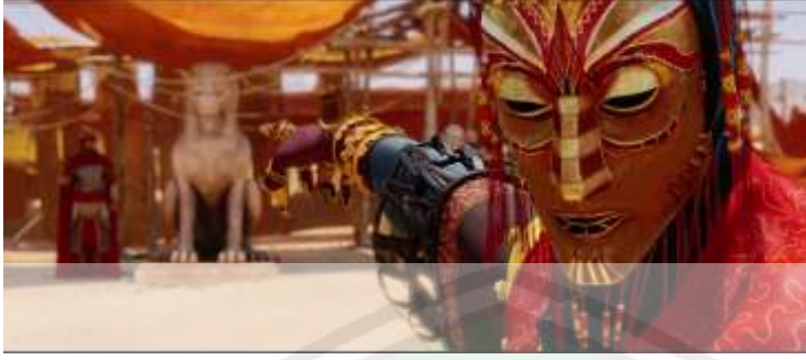
الصورة ١٦ : شهادة الكاهن عن آلهته

في البيان أعلاه، ذكر الكاهن أنّ الآلهة الذين يعبدونه حتى الآن هي الأصنام التي يملك الصورة كالحيون، ولديها القوة والقدرة على مسح خطيئتهم لكن ربما يعترفون بربهم ويعترفون خطيئتهم واعتذروا عن إلههم. (ب) نظام الثقة والعادة