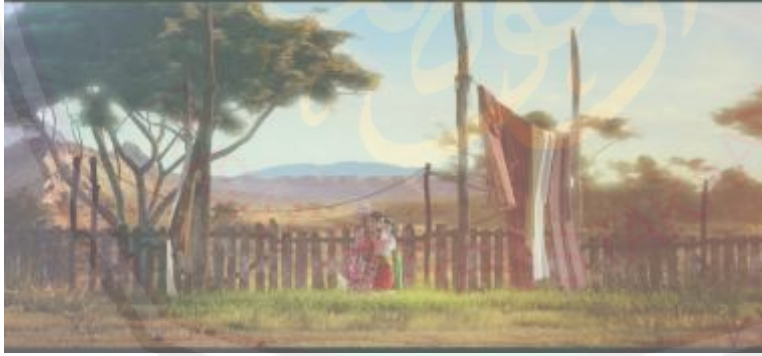
الصورة ١: صورة حياة المجتمعة الريفية

بدأ التصوير في فيلم بلال انيو بريد بتصوير حياة بلال في مجتمع قروي ريفي، والمجتمع القروي الريفي هو المجتمع الرحل الذي يعيش في المنطقة الصحراوية وينتقلون الأماكن لمتابعة الواحات ومصادر المياه في كهوف الوادي في ضواحي مكة، والمدينة المنورة والطائف. السكان الذين يعيشون في مدينة مكة من السكان المستقرّ والتجّار، وهم من أرسقراطيين في مكة. وإما السكان الذين يعيشون في القرى هم من الذين يعيشون في الخيام والبدوي وأما حياتهم معلقة بالصحراء. كان العرب البدوي قبيلة لم تستقر حياتهم وهم تنتقلون (بدوية).