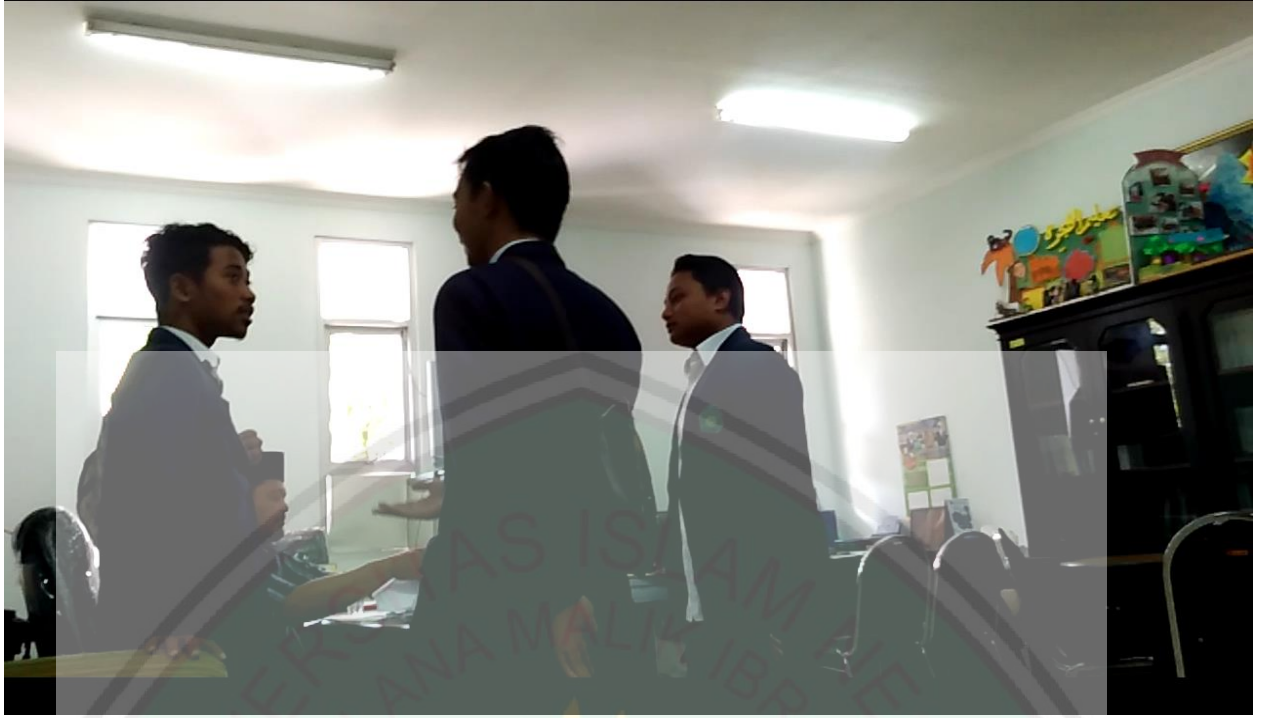
صورة من المحادة