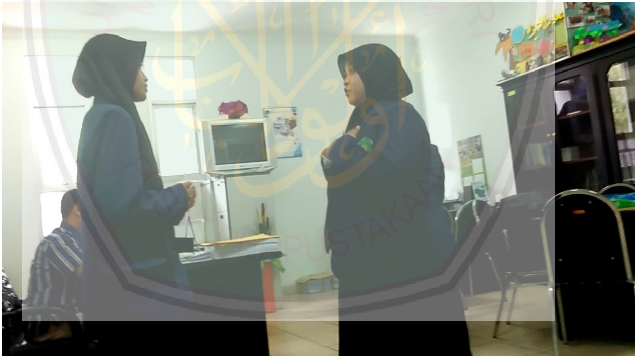
صورة من المحادة