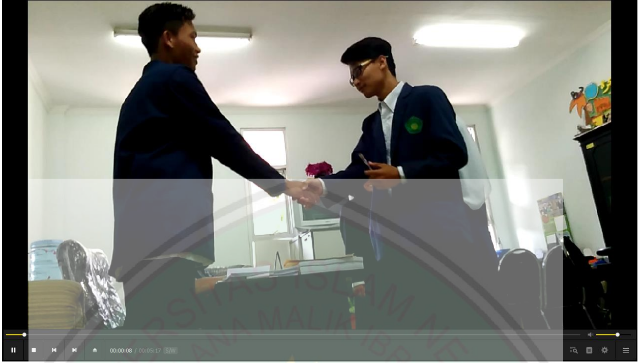
صورة من المحادة