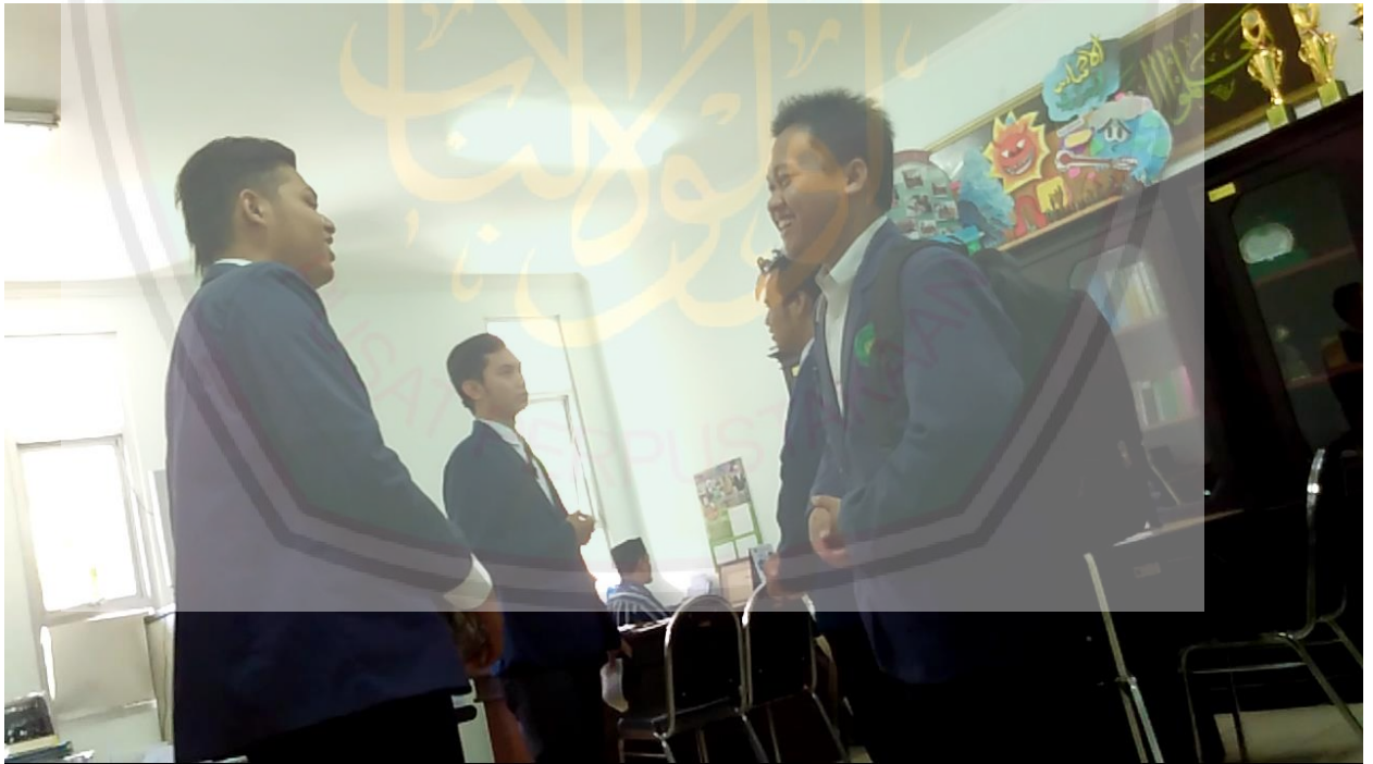
صورة من المحادة