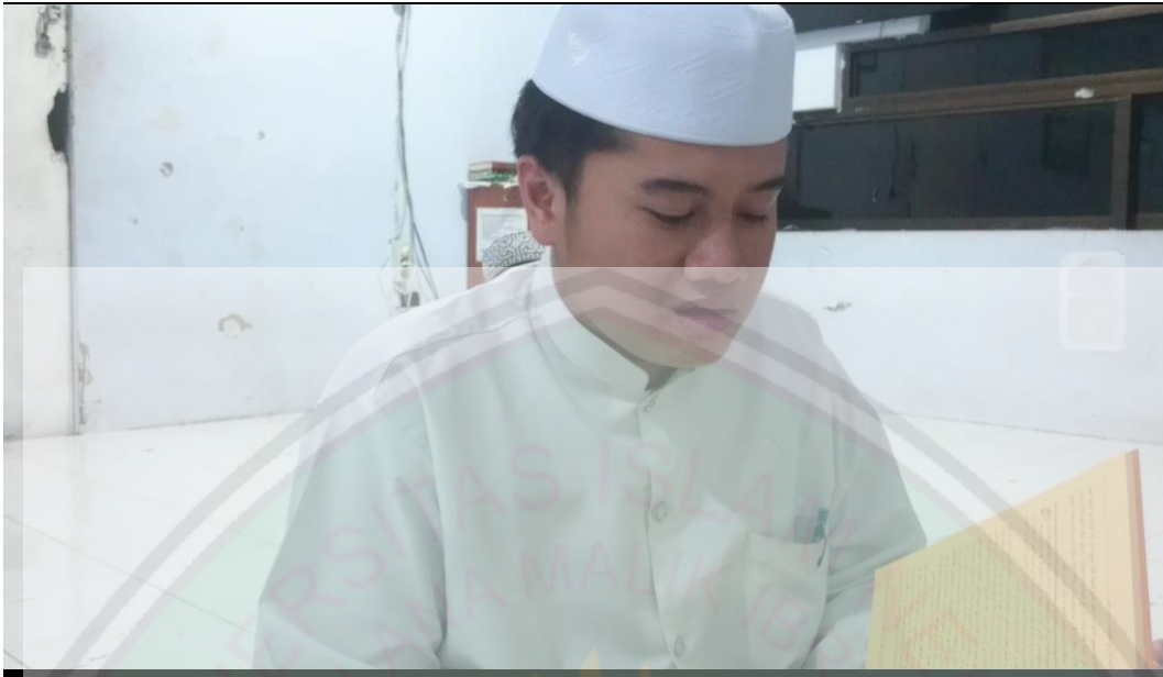
Saat santri diberi kesempatan membaca kitab