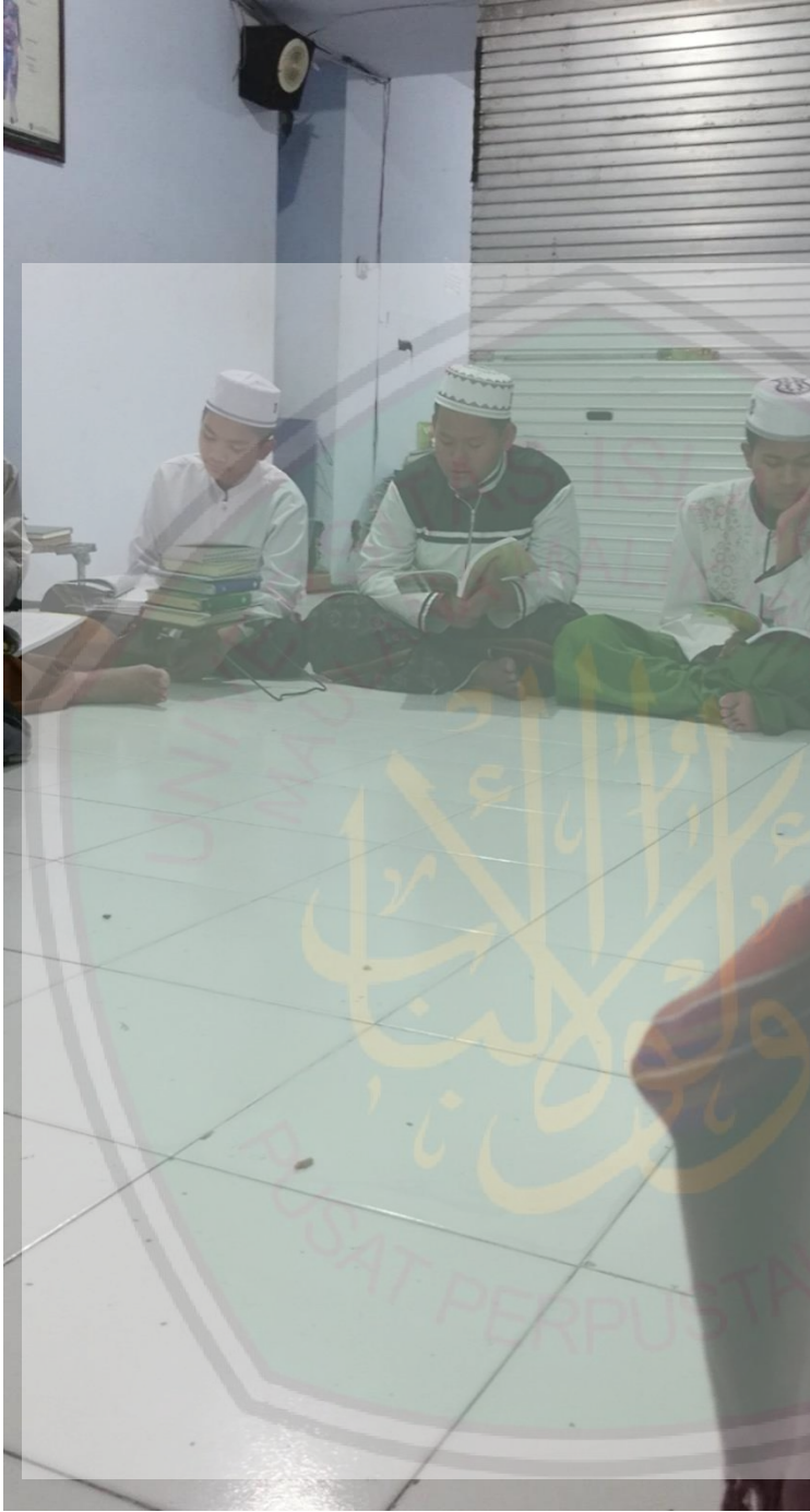
Suasana Pembelajaran berlangsung