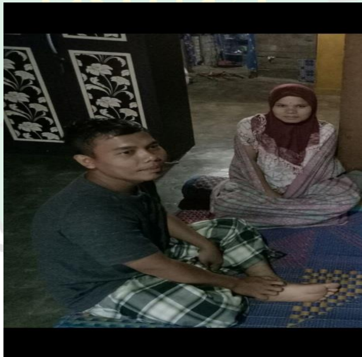
Foto wawancara dengan penyewa karet