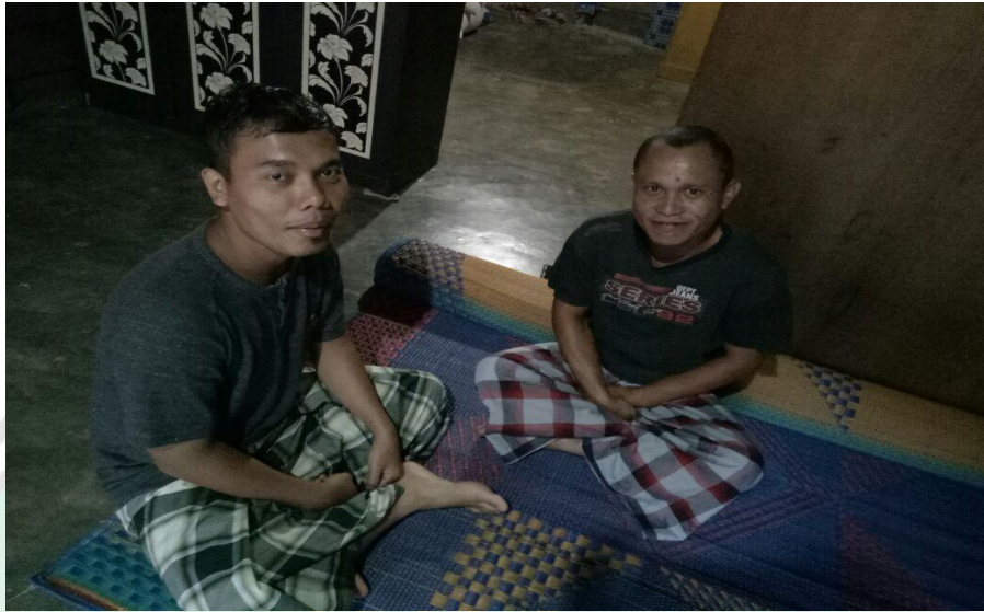
Foto wawancara dengan pemilik karet produktif