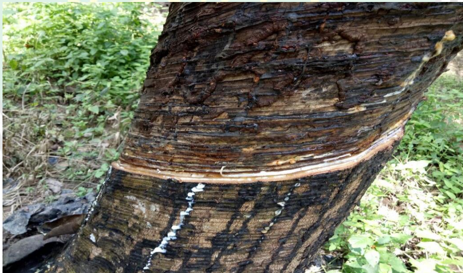
Foto pohon karet produktif