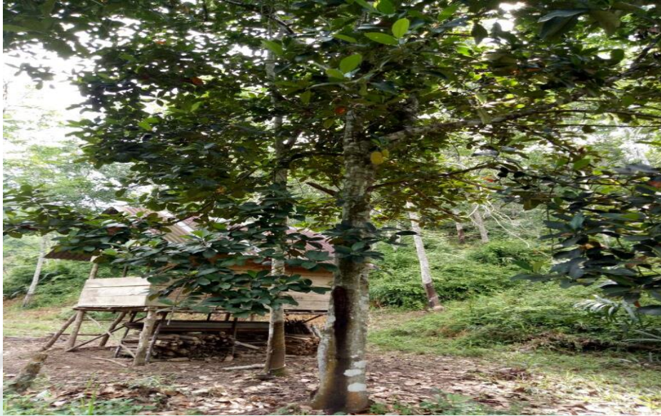
Foto lahan karet produktif