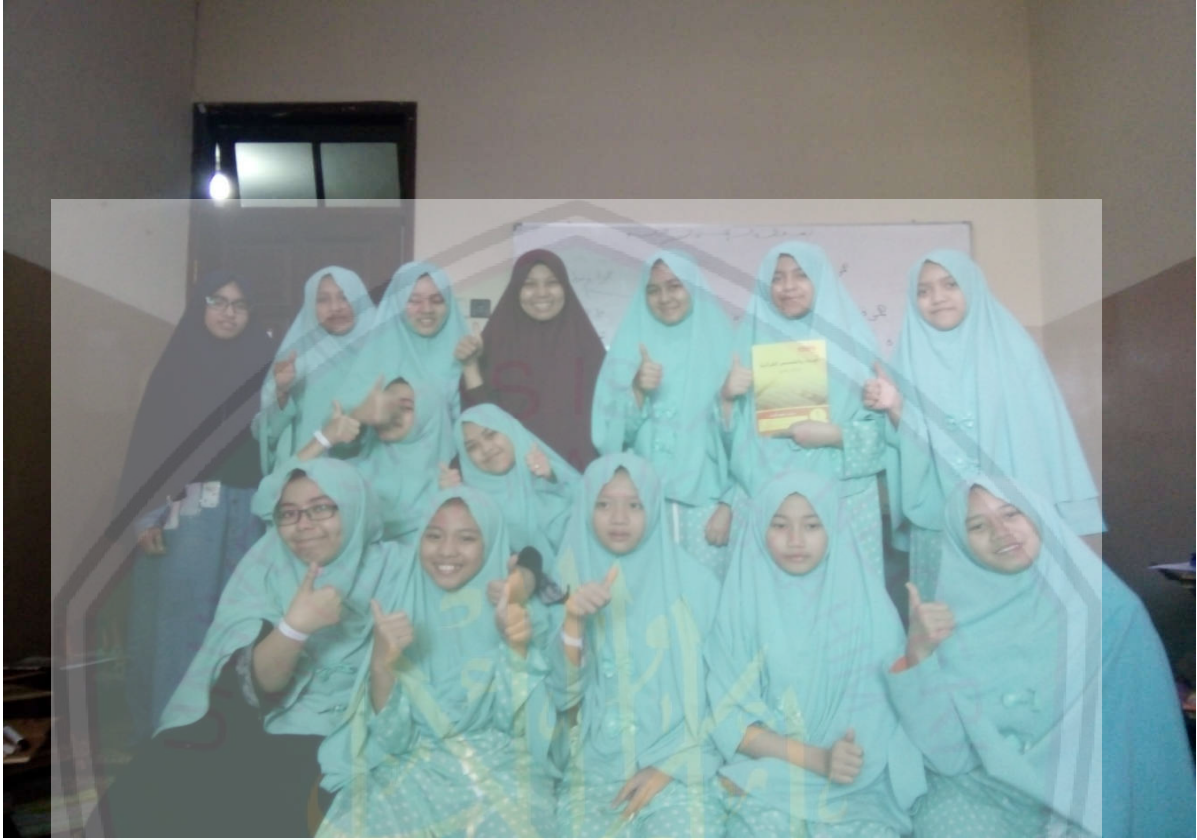
الصورة مع المعلمة اللغة العربية والإملاء