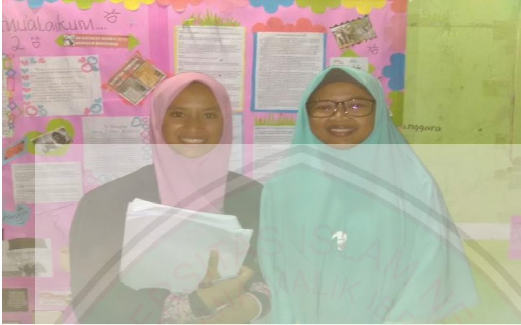
Foto setelah wawancara bersama bagian Bahasa.