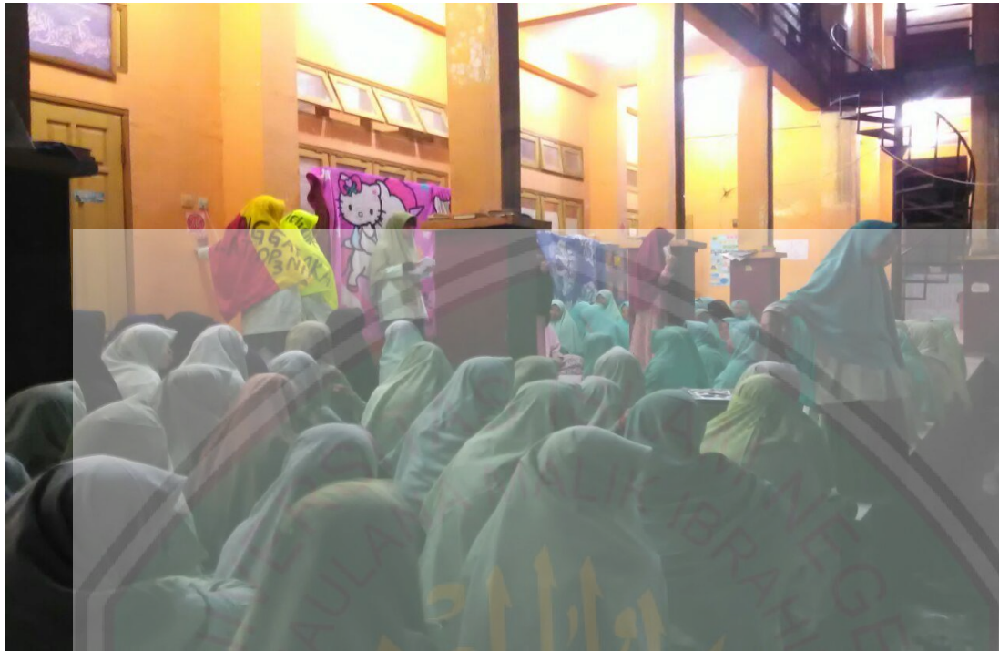
Kegiatan Muhadaroh yaitu salah satu kegiatan mingguan dari bagian bahasa.