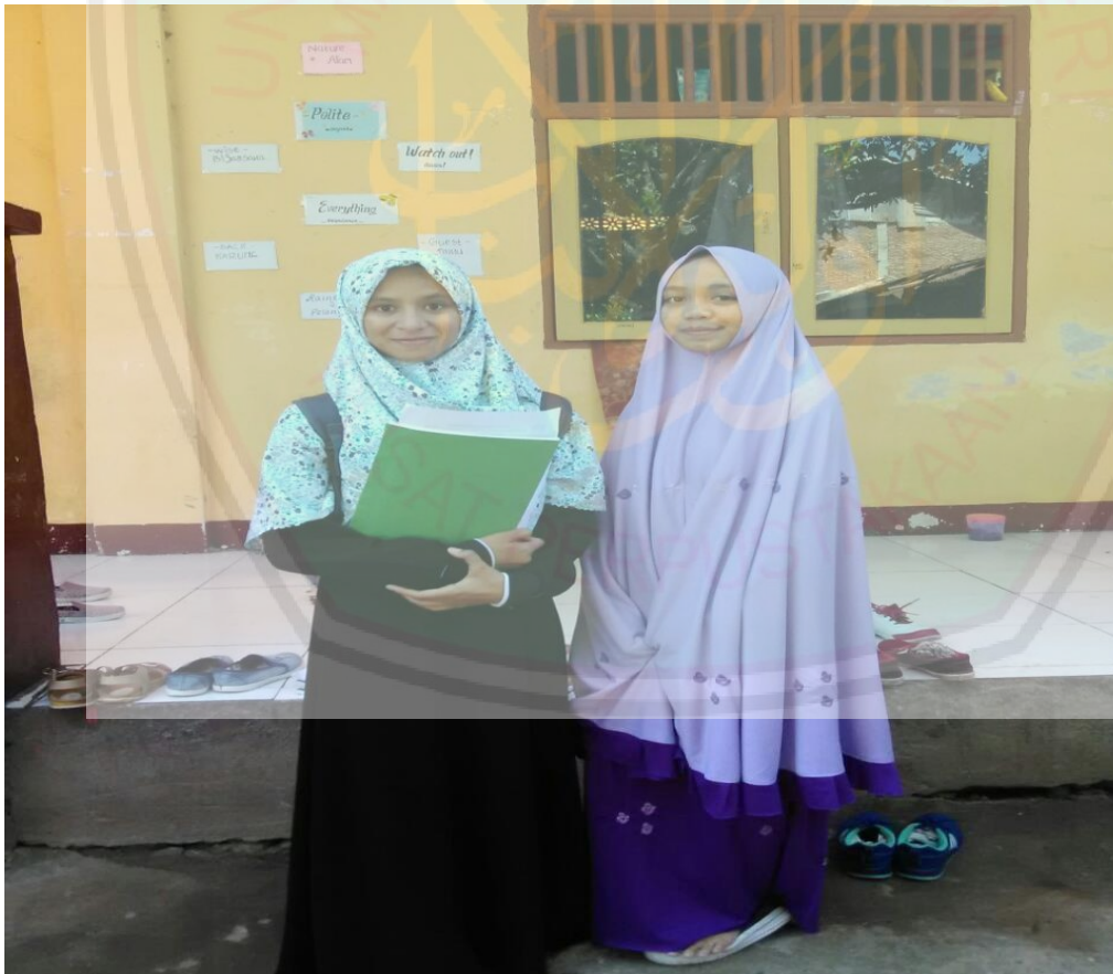
Foto setelah wawancara bersama salah satu ustadzah Pembina.