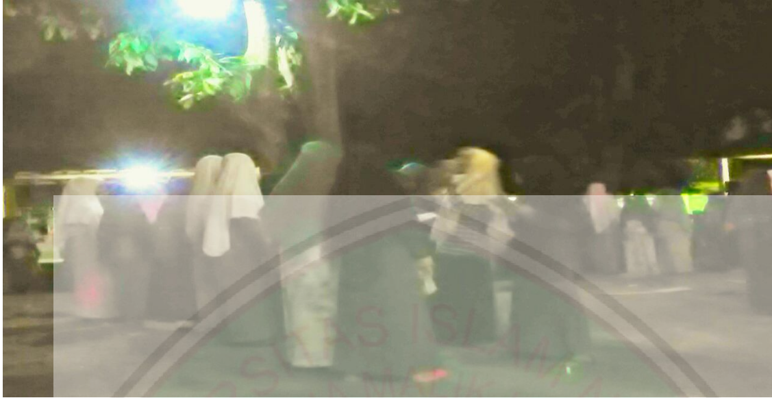
Kegiatan Muhadtsah sebelum tidur yaitu salah satu kegiatan rutian harian bagian bahasa.