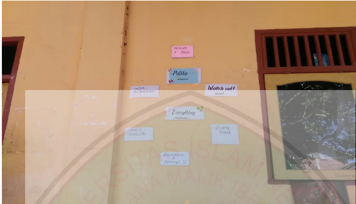
Gambar Pamflet B.Inggris.