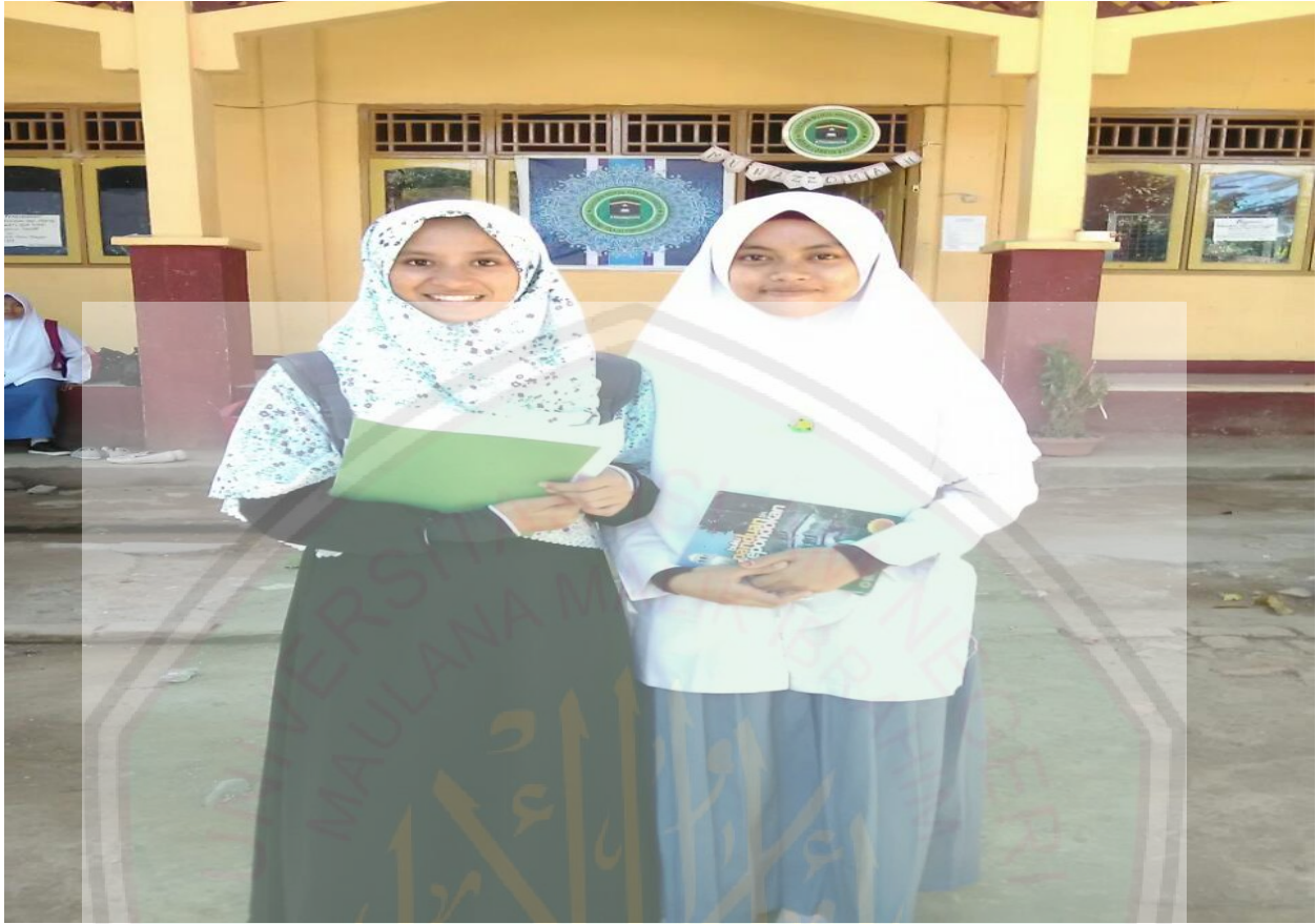
Foto setelah melakukan wawancara bersama ketua pengurus Pondok Pesantren Nurul Hakim.