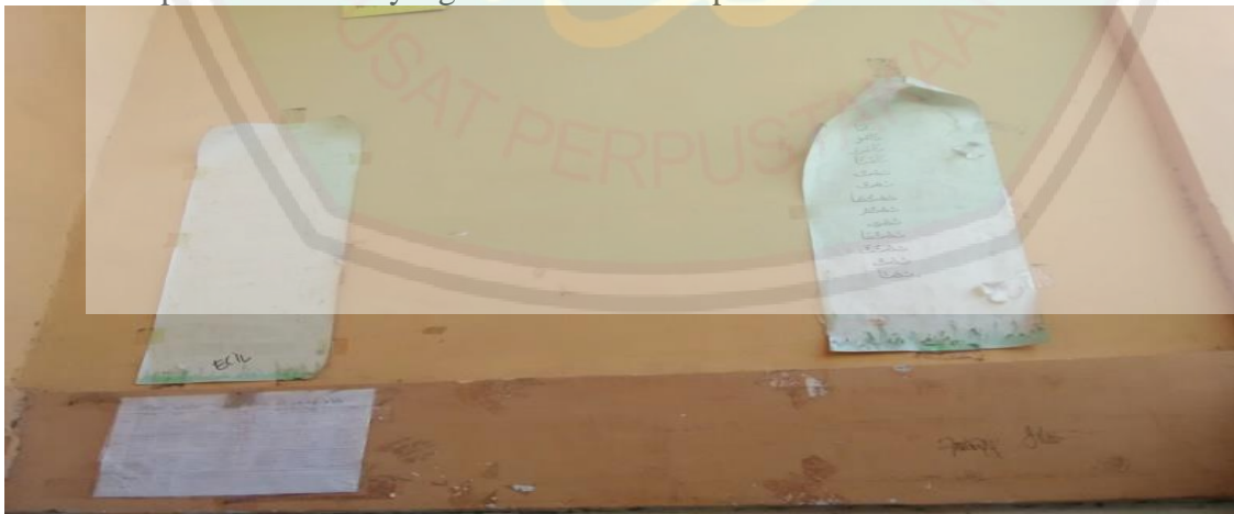
Gambar Famplet Mufrodad B.Arab yang sudah lama tidak diperbarui.