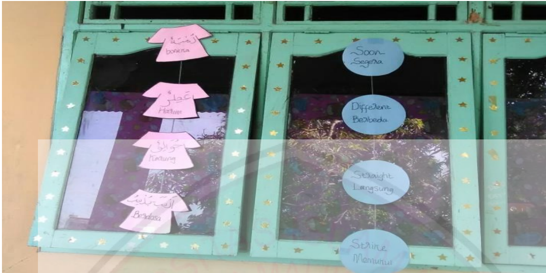
Gambar Famplet Mufrodad B.Arab dan B.inggris yang sudah lama tidak diperbarui