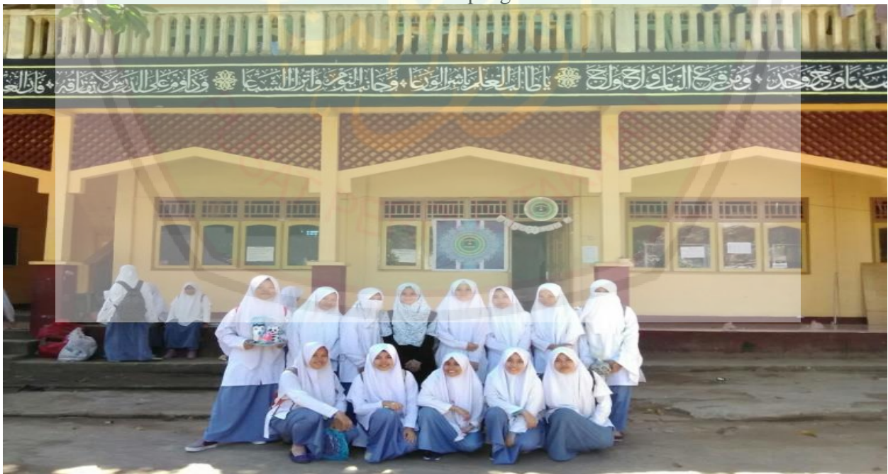
Foto bersama pengurus Pondok Pesantren Nurul Hakim