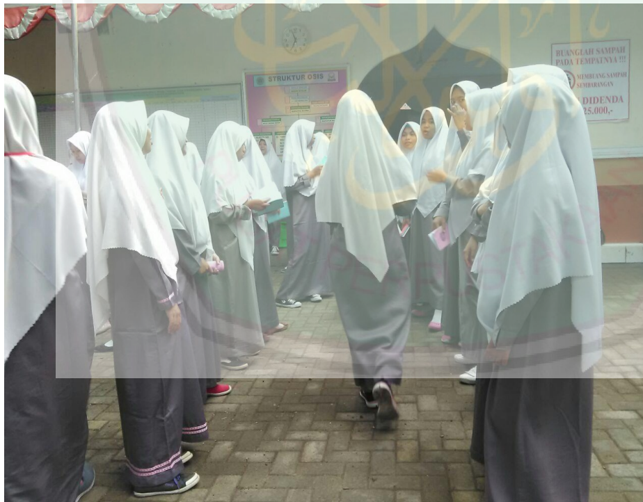
Kegiatan Muhadtsah pagi sebelum masuk kelas yaitu salah satu kegiatan harian dari bagian bahasa.