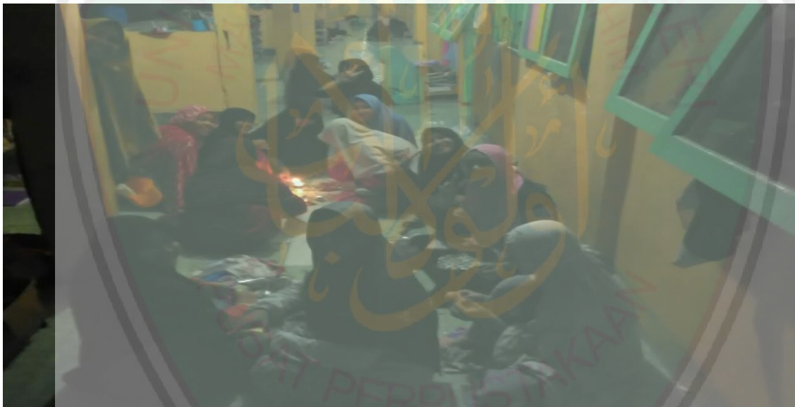
Kegiatan mengulang pelajaran bersama teman-teman sejawat sebelum tidur.