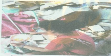
gambar 4 : kondisi rumah Awi (informan)