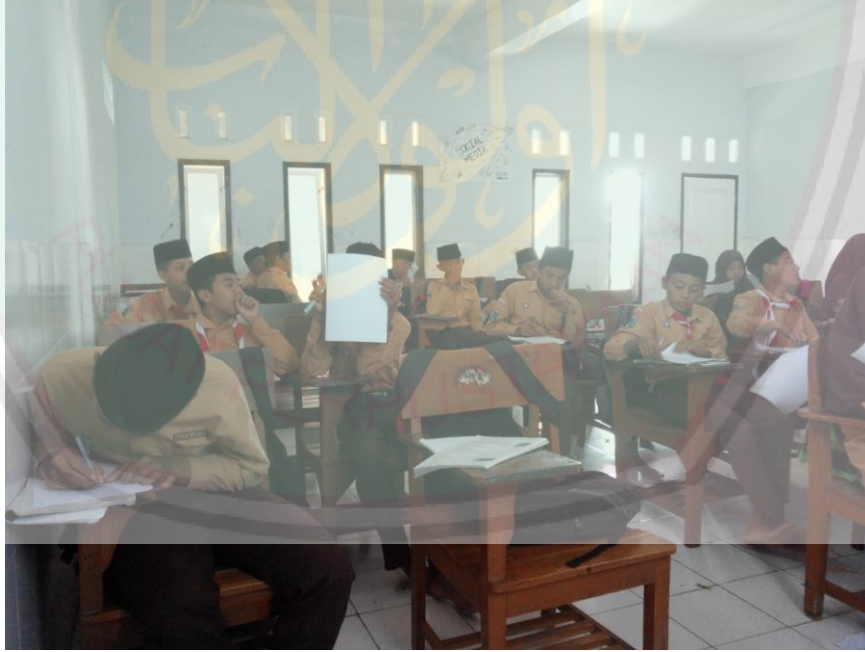
إختبار البعدى فى الفصل الضابطى