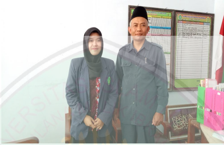
بعد إنتهاء من المقابلة مع المدير المدرسة تربية المبلعين الإسلامية المتوسطة بوجون