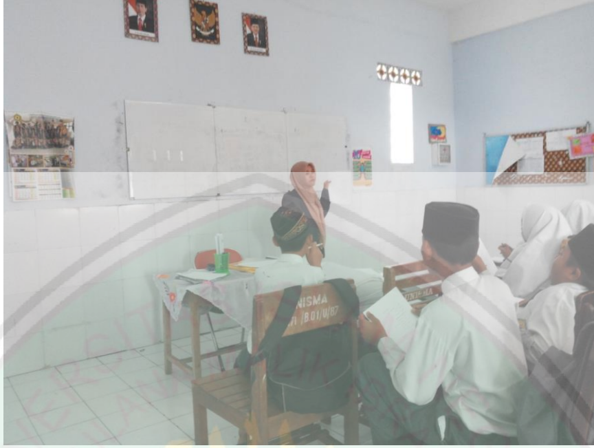
إختبار البعدى فى الفصل التجريبي