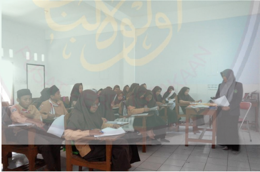
إختبار القبلى فى الفصل الضابطى