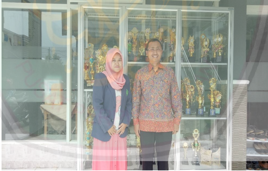
بعد إنتهاء من المقابلة مع المدرس اللغة العربية مدرسة تربية المبلعين الإسلامية المتوسطة بوجون