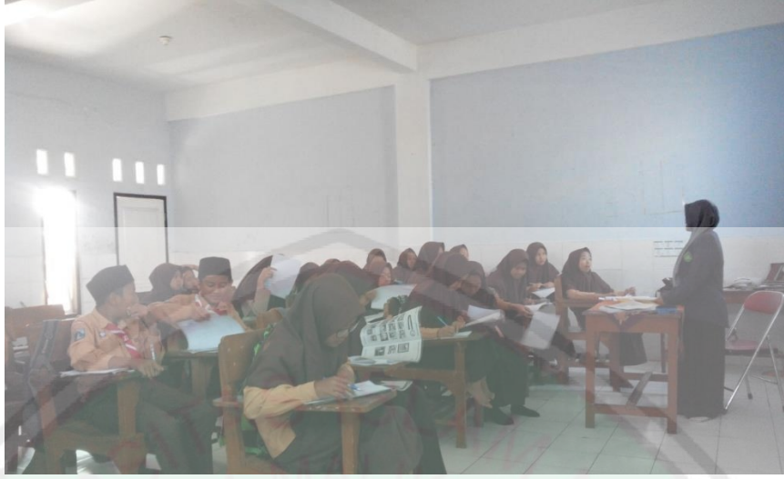
عملية التعليم المادة اللغة العربية في فصل الضابطى