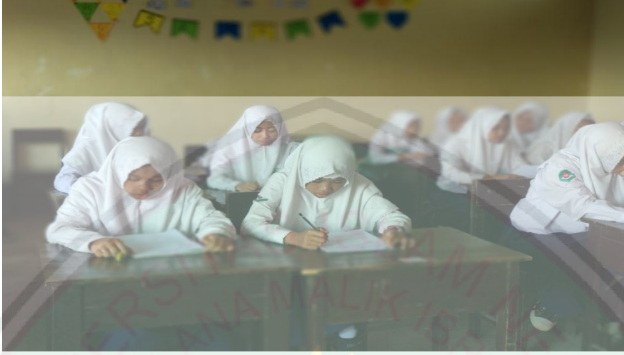
الإختبار في الفصل التجريبية