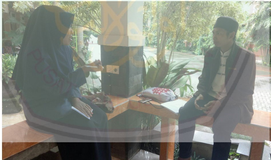
Wawancara dengan Bapak Muallimin selaku Pelatih Ekstrakurikuler Keagamaan