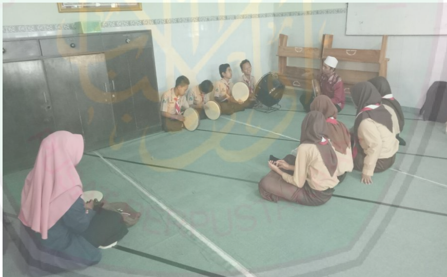
Siswa siswi SMPN 3 Malang latihan Albanjari di latih oleh Bapak Mualimin