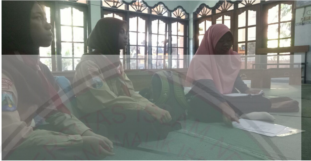
Wawancara dengan siswa Putri