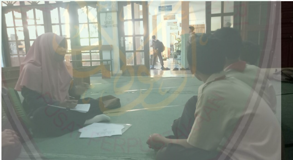
Wawancara dengan siswa Putra