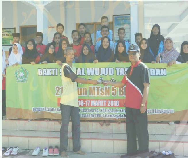
Bakti Sosial Cinta Lingkungan