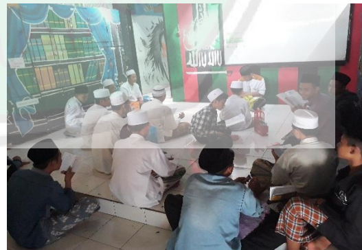
Gambar 4 : Proses setoran hafalan nadzom di PP Darul Falah