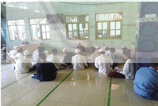
Gambar 3 : Proses pembelajaran Amsilati di PP Darul Falah