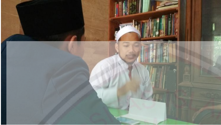
Gambar 1 : Proses wawancara dengan pengurus PP Darul Falah