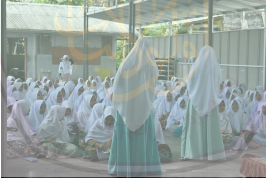
(عملية صباح اللغة يعني منح المفردة الجديدة)