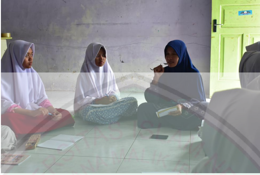
(عملية لقاء أسبوعية مع مشرفة اللغة)