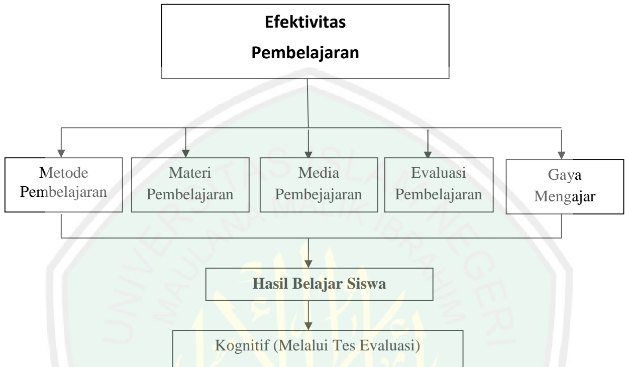
Gambar 2.1 Kerangka berfikir