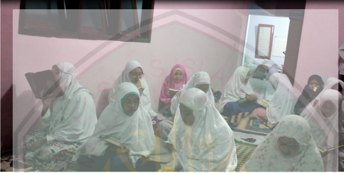
عملية القراءة بالانفس