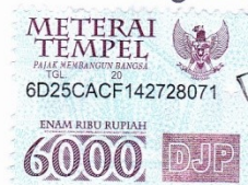
Moh Alfian Bahrul Ulum

Malang, 15 Januari 2014 Yang membuat pernyataan