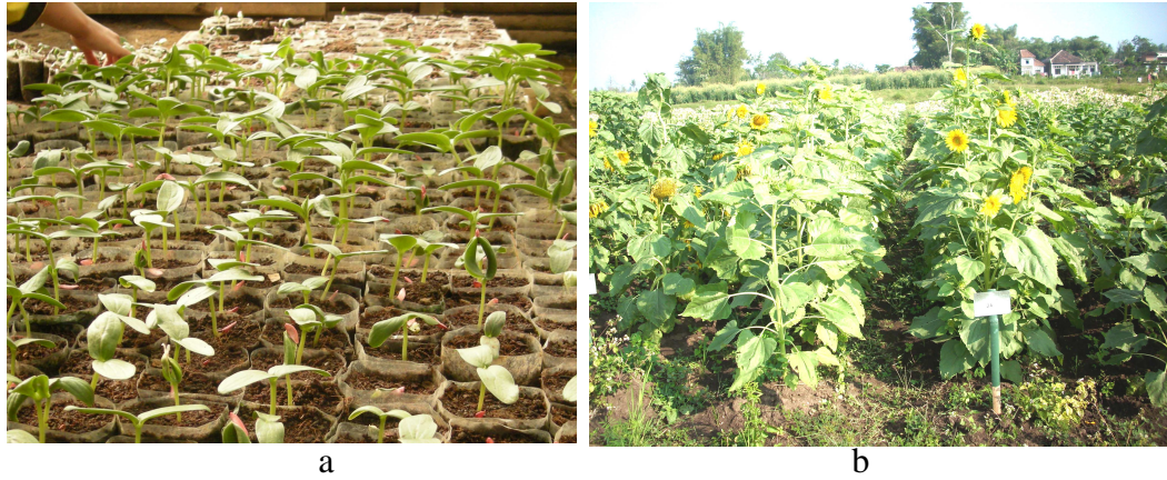
Gambar 1. Penyediaan tanaman inang, a) Media semai bunga matahari, b) Bedengan / lahan tanaman bunga matahari.